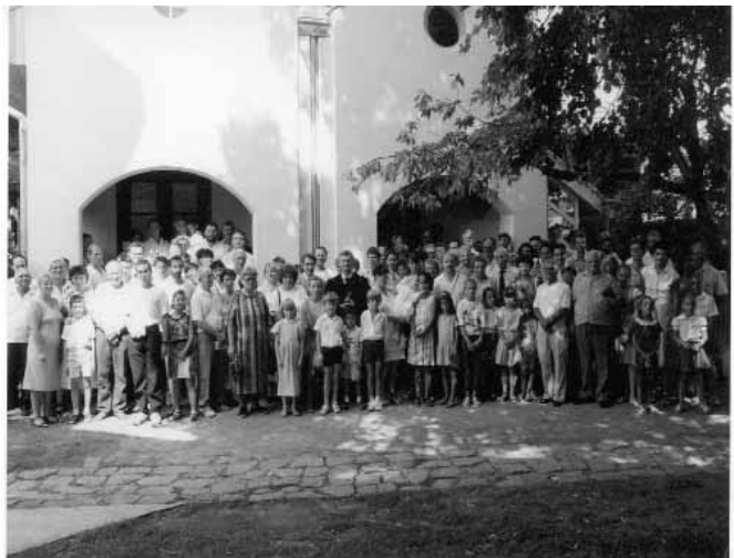
1992-93-ban készült el a kápolna, a tetőtéri ifjusági terem és a kiszolgáló helyiségek