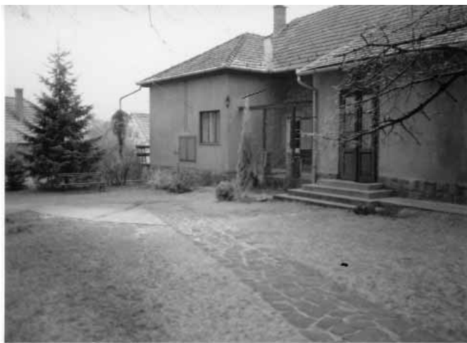
A parókia és a lelkészi hivatal bejárata egykor az építkezés előtt