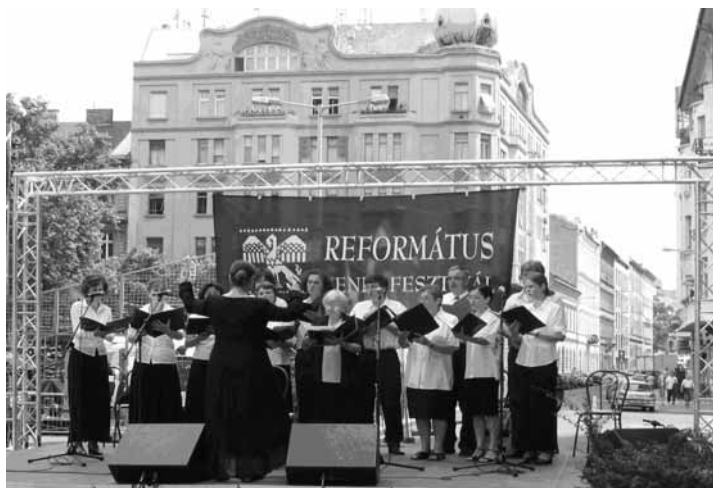
Énekarunk a 2006-os budapesti egyházzenei fesztiválon énekel

Kórusunk folyamatos működéséhez elengedhetetlen a próbákon való rendszeres részvétel. Kevesen tudják vállalni a napi munka, családi teendők, sok más szolgálat mellett az énekkari tagságot, mégis arra biztatunk minden énekelni vágyót (nem csak a kottát olvasókat, énekelni tudókat!), hogy szolgálják ily módon is az Úr dicsőségét! Énekarunk tagtoborzást hirdet. Nőket és férfiakat, lányokat és fiúkat egyaránt szeretettel hívogatunk. Várunk minden énekelni vágyó érdeklődőt körünkbe, azokat, akik szeretik a közös éneklés örömét és vállalják a heti egy óra gyakorlást, az időnkénti "gyülekezeti fellépést", a szolgálatot. Várjuk azokat, akik örömmel jönnek velünk szolgálni, kirándulni más gyülekezetekbe is, vagy énekelni egyéb kórusrendezvényen. Várjuk Önt is sorainkba! Kérjük, tolmácsolják hívásunkat a környezetükben élő olyan kereső embereknek, akik nem találtak el hozzánk. Nem kívánunk különleges képességeket, csak nyílt szívét-lelket. A közös éneklés, a szolgálat nemcsilló örömet találjuk meg az együtt töltött idő alatt, hiszen jó dicsérni az Urat!