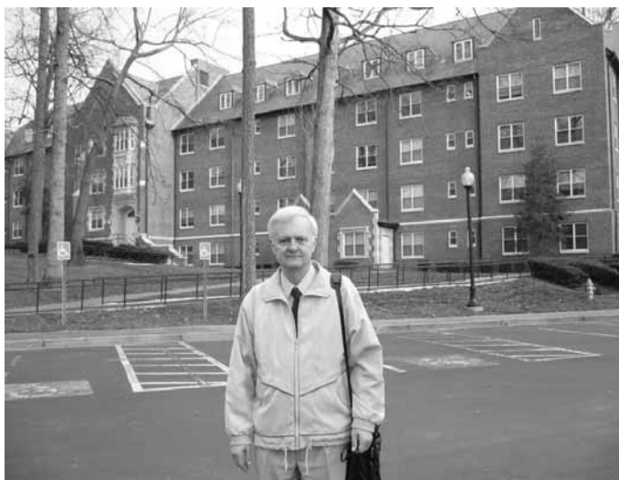
A Columbia Teológiai Szeminárium diákszállója

Igen, mert először elutaztunk oda! De hát hogy is volt ez? Meghívást kaptunk feleségemmel, a Református Gimnázium igazgatójával együtt az Orlando-i (Florida állam) Első Presbiteriánus Egyházközségtől, hogy vegyünk részt missziói hetükön, melyre meghívást küldtek mind azokra a helyekre szerte a világon, akikkel csak testvéri kapcsolatot tart a gyülekezet. Már pedig a mi szentendrei református gyülekezetünk éppen ilyen: 1999 óta minden nyáron jöttek tőlük önkéntes segítők anyanyelvi angolt (amerikait!) tanítani gimnáziumunkban, és ezt a nyolc éves testvéri kapcsolatot ők most ezzel a mi meghívásunkkal külön is megbecsülték.