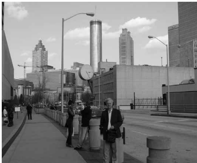
Atlanta belvárosa a felhőkarcolókkal

Atlanta belvárosa pedig (ahol időközben olimpia is volt) szintén a régi a maga nevezetes épületeivel, csak tisztább és gondosabban őrzött, mint régente. A képen is látható kör alakú szálló hetvenharmadik emeletén pompás panoráma tárul az ember elé a lassan körbe forgó kávéházból, ide feltétlenül el kell látogatni, ha valaki Atlantában jár.