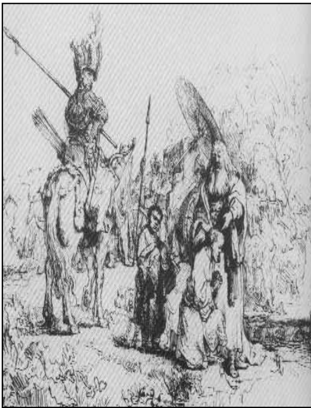
Rembrandt: Az etióp főember megkeresztelése