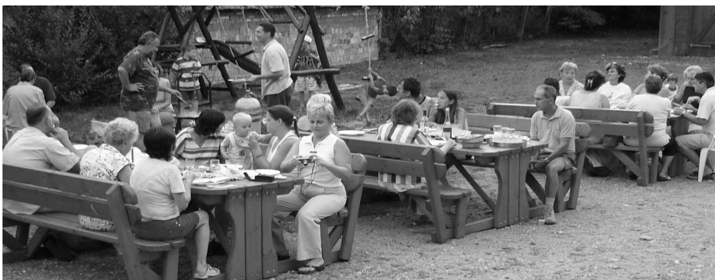
Életképek gyülekezetünk tivadari napjairól (2007. aug. 8-12)