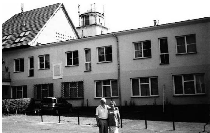
Épül a gimnázium imaterme

Erről nehéz összeszedetten beszélni, hiszen belső történésekről van szó, és az ember saját magát mindig másként látja, mint a többiek. Egzakt korszak-határokat nem is nagyon tudnék megnevezni. A kezdeti, sokszor tekintet nélküli, minden áron való igyekezetet ma már talán több türelem és némi bölcsesség is járja át, bár itt valószínűleg mindig sok fejlődni valóm marad. Hitemben a különböző gondok az évek során inkább megerősítettek, az ige pedig naponként soha nem ismert ízeivel és erejével táplál. Úgy érzem, egységesebb lett a világlátásom, jobban "helyükön vannak" számomra a dolgok, valahogy mintha kevésbé lenne homályos és átláthatatlan a világ. A saját igyekezeteimről pedig átkerült a hangsúly arra, amit Isten tesz velünk. Ezt áldott gyülekezeti munkatársaim sok-sok segítségével naponta különösen is megtapasztalom, amit itt felsorolni is nehéz volna. Isten után életem párjának és nekik tartozom a legnagyobb köszönettel azért, hogy a nyilvánvalóan sok gond és veszedelem mellett is derűsebben tudok a világra nézni, mint valamikor.