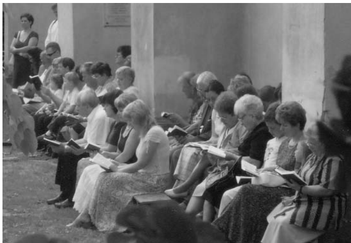
Istentisztelet a templomudvaron 2007. július 8-án

A tornaterem EU-s pályázatának elkészítése kéthónapos munka volt, amelyben közel húszan vettek részt; ezenkívül még professzionális pályázatíró cég segítségét is kérnünk kellett. A kiírás akadálymentesítésre vonatkozó követelményei miatt módosíttatnunk kellett a már korábban elkészült építészeti terveket, és külön akadálymentesítési tervet is kellett készíttatnunk. A július közepén beadott pályázatunk végül 216 oldal terjedelmű lett. A tervezett projekt költségei több mint 270 millió forintba rúgnak, amiben azonban az építkezésen túl a tornaterem teljes sporttechnológiai felszerelésének, sőt - a pályázati kiírás elvárásaihoz igazodva - még közel 18 millió forintnyi infokommunikációs eszköznek (számítógépek, digitális vetítők, interaktív táblák, programok stb.) beszerzése is szerepelt. A költségek 10 %-át, azaz kb. 27 millió forintot egyházközségünknek kellene állnia, de biztosra vehető, hogy lennének még további járulékos költségek is. A pályázat elbírálása októberre várható, ez magyarázza, hogy addig mindenképpen tartalékolnunk kell a félretett pénzünket, pl. a templom renoválására szánt összeget is. Természetesen a pályázattól függetlenül a már korábban elkezdett gimnáziumi tetőtér-beépítésünket olyan állapotba kell hoznunk, hogy a még nyitott rész tére le legyen zárva.