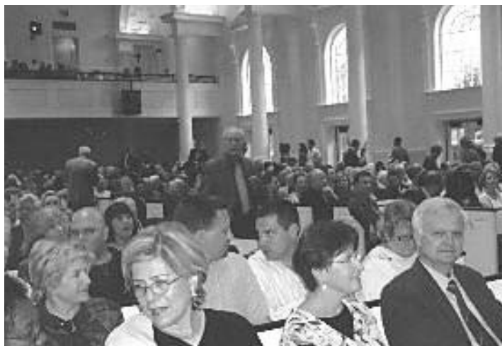
Az Orlando-i gyülekezet temploma

Érdekes és megkapó élmény volt az ő általános iskolájuk, a Christ School meglátogatása. Elsőtől nyolcadikig tanítják itt a fiatalokat, és a diákok kifogyhatatlanok voltak a kérdésekben.