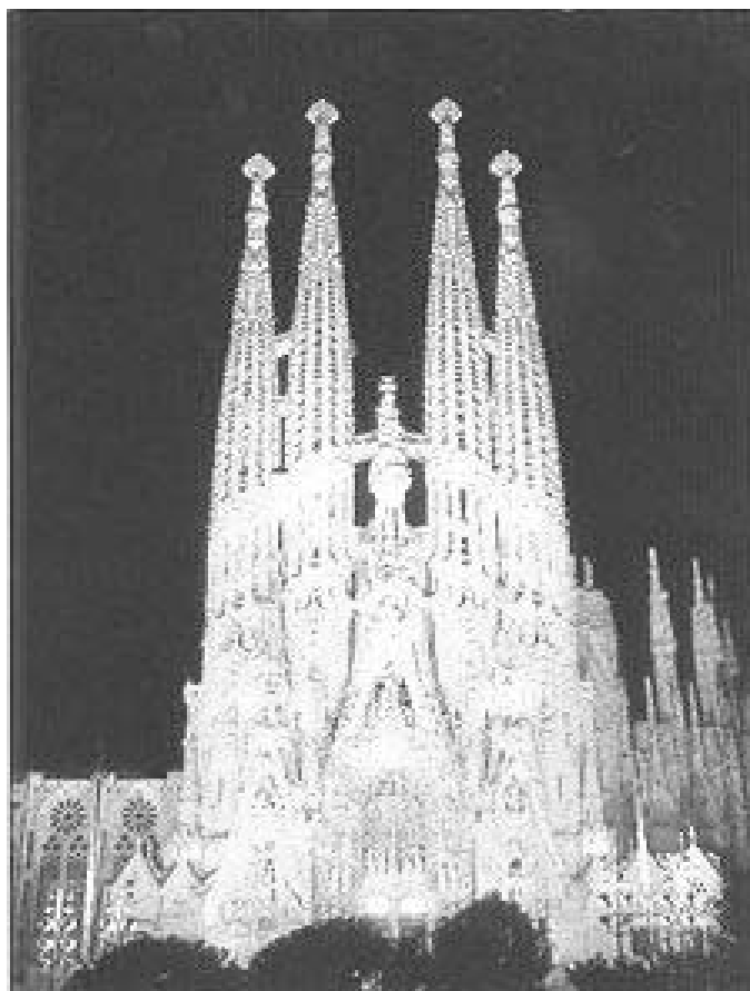
Az épülő Sagrada Família katedrális Barcelonában. Ez a születés temploma.