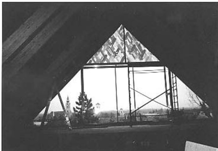
Alakul az imaterem üvegfala