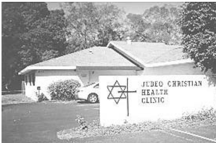
A Tampa-i gyülekezet szakorvosi rendelője