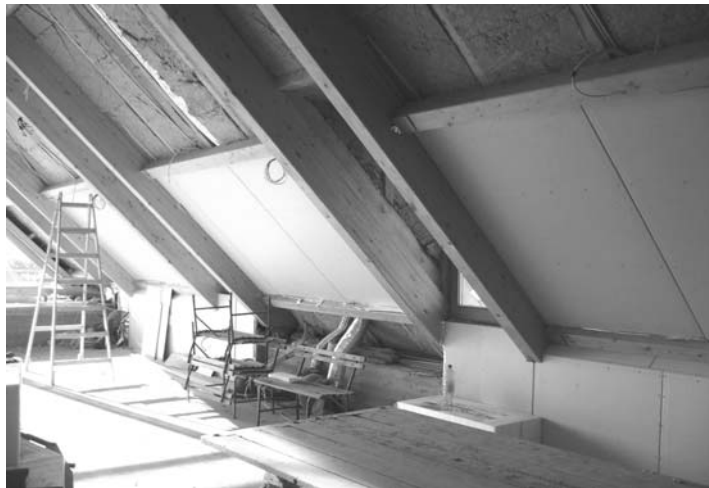
Készül a gimnázium kápolnájának belső burkolása

Előző számunkban beszámoltunk arról, hogy elkészült a gimnáziumunk tetőterének üvegfala. Azóta elkezdődtek a belső építési munkák is (villanszerelés, burkolatok felszerelése). Az építkezés folytatását az tette lehetővé, hogy a gimnázium megkapta az elmúlt két év állami támogatásainak visszatartott részét, és a gimnázium vezetése a Presbitériummal egyetértésben úgy döntött, hogy ebből az összegből mintegy 16 millió forintot erre a célra fordít.