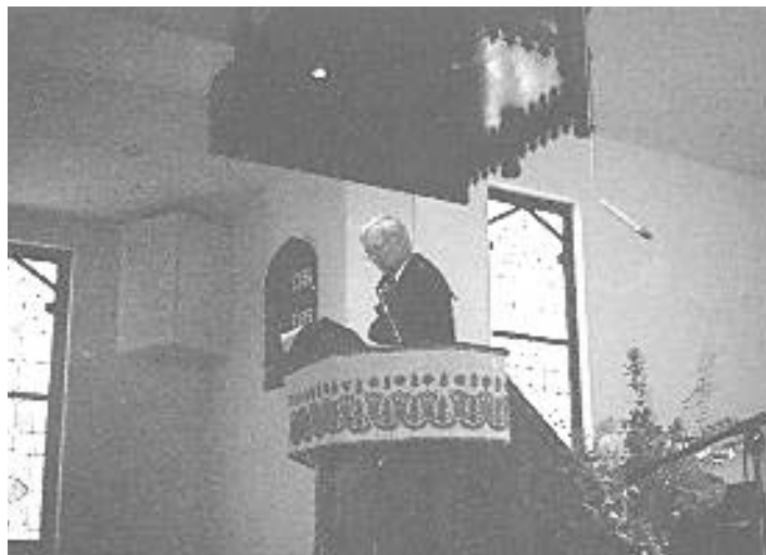
Igehirdetés Los Angelesben

Este Vémiéknél még vacsora utáni házi-bibliaóra is volt. Nagyon érdekes és tanulságos bepillantani az ottani lelki kérdésekbe és gyülekezeti életbe.