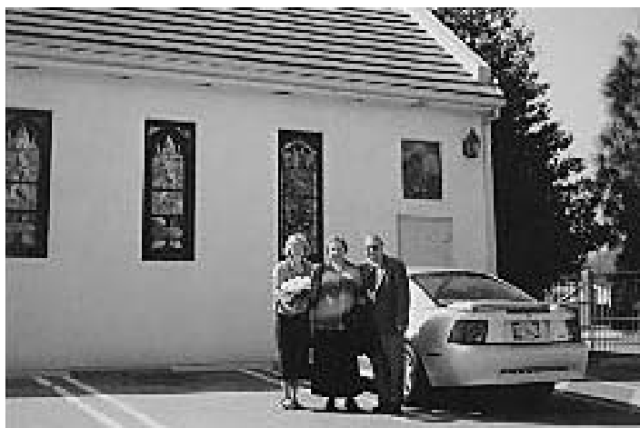
A Vémi házaspár és San Fernadó völgyi templom

Vasárnap délelőtt angolul és magyarul kellett ígét hirdetnem a templomukban, ahol nagy örömeinkre minden korosztály képviseltette magát.