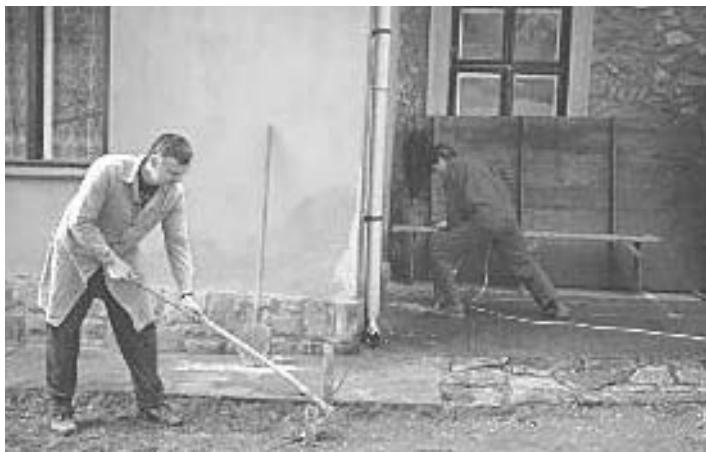
Szó szerint az "első kapavágások" 2002-ben

Pénzünk ugyan nem volt rá, de sok áldott segítő kéz és igazi lelkesedés építette meg az emeleti ifjúsági termet, a lépcsőházat, a kiszolgáló helységeket és a kápolnát. Azóta így három külön csoportban tudunk foglalkozni a gyermekekkel, és a megépült új helységek is természetes részévé váltak gyülekezetünk életének. Az akkor folyt építkezésre tekintünk vissza hálaadó szívvel ezekkel a képekkel.