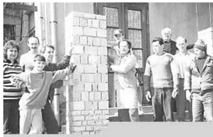
Még nincsenek boltívek