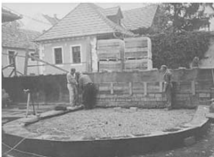
Itt lesz majd a kápolna!