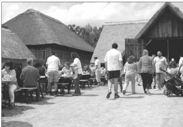
Az ebéd helyszíne...