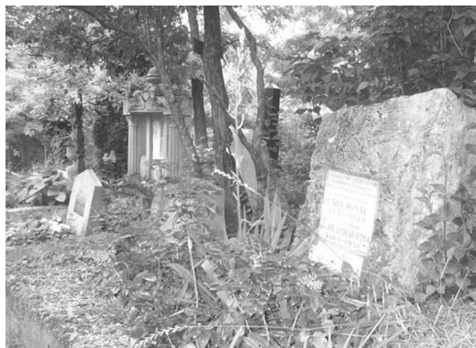
Gondozandó régi temetők a sírokkal

"Frissen lüktet az élet érverése, s az éteri hajnalpírt köszönti újra; ó, föld, nem ingatott meg ez az éj se, üdén pihensz a lábamhoz simulva; megkörnyékez derűd s mozdítja bennem az elszánást, hogy szakadatlanul a lét legfelsőbb fokára törekedjem. - "