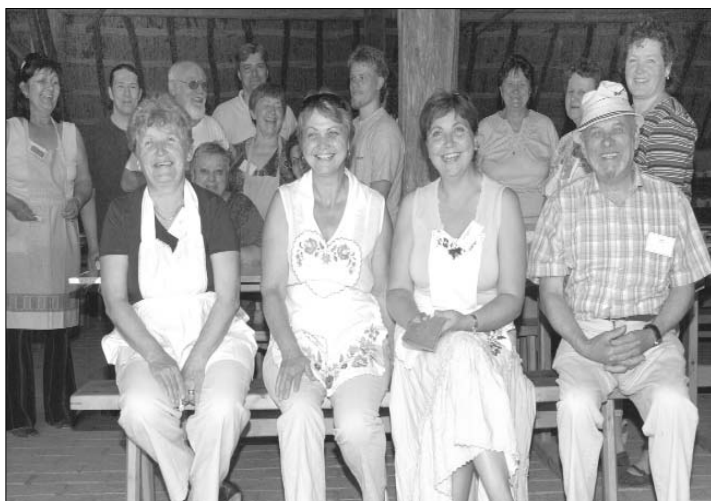
és a lelkes csapat, aki a felszolgálásban jeleskedett.