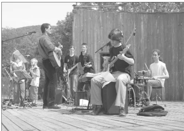
...melyhez a zenét a Református Gimnázium együttese adta...