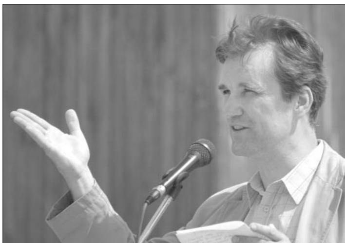
Lux Ádám színművész vallott szeretetről, hitről és keresztyéni életéről.