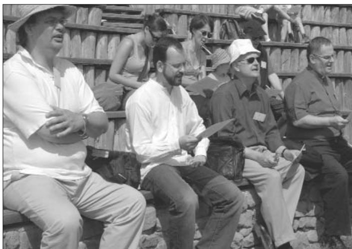
Közös énekléssel indult a nap...