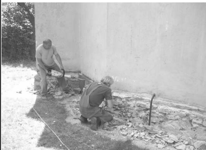
Elkezdődött templomunk renoválása