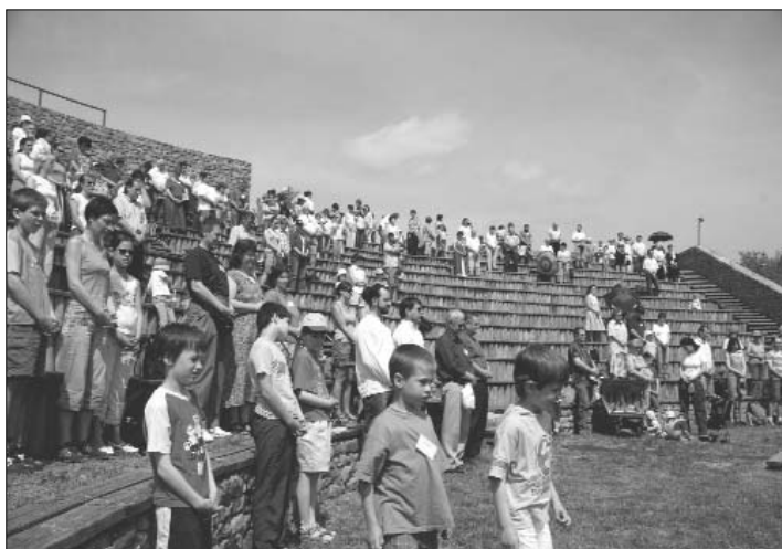
amit közös ima követett