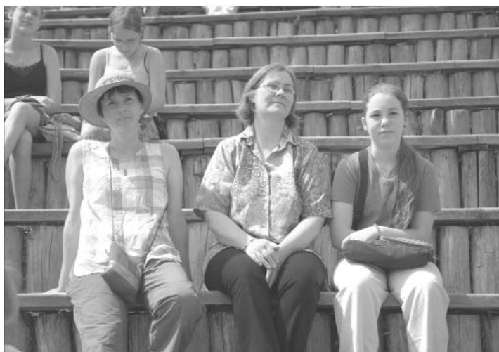
Ismerős arcok a közönségből

Csaknem 1200-an vettünk részt reformátusok, római katolikusok, evangélikusok, baptisták május 17-én a Szabadtéri Néprajzi Múzeumban, az ökumenikus családi nap programjain. A családi programok mellett külön helyszínen szólították meg a tipegőkkel érkezőket, az óvodásokat, az iskolásokat, valamint a felnőtteket.