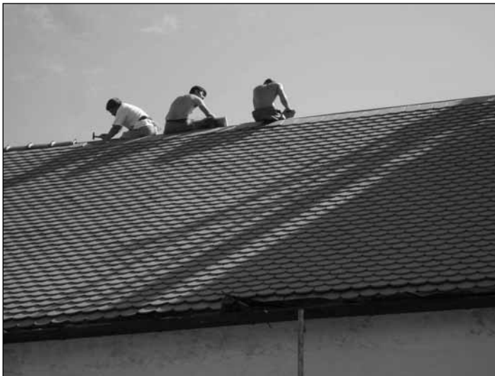
Tetőfedők a gerincen