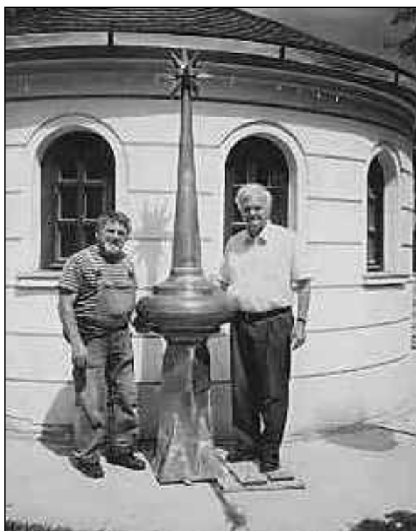
Az új vörösréz toronycsillag

“Azért ha valaki Krisztusban van, új teremtés az, a régiek elmúltak, imé újjá lett minden” (2. Kor 5, 17)