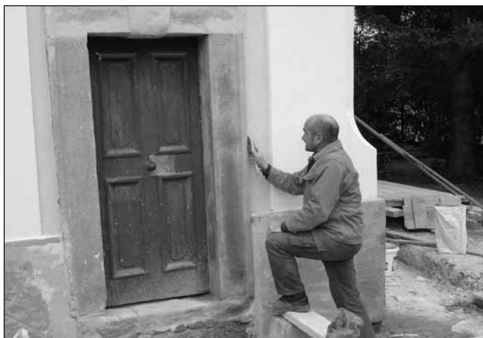
Restaurátori munkára is szükség volt

“Testvéreimért és barátaimért mondom: Békesség neked! Istenünknek, az Úrnak házáért is jót kívánok neked.”