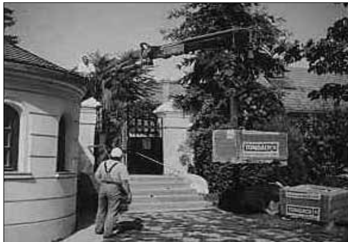
A tonnás cserép-csomagok megérkeznek