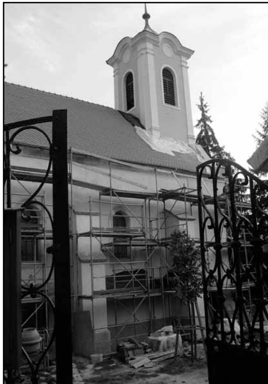
A megújuló szentendrei református templom (ld. még: 2-4. old.)

Az istentisztelet hetenként megszületett példáján eltöprengve, Reformáció ünnepének havában, az egyháztörténeti fordulat 491-ik évfordulóján ebből az irányból is megvizsgálhatjuk reformátor eleink egyik legnagyobb teológiai felismerését, vagyis mit tesz az ember és mit tesz Isten. Tovább forgatva a gondolatot, az istentiszteleti közösség a keresztyén ember életében a váratlanul nyíló "rózsák és liliomok" ajándéka (Luther). De mint