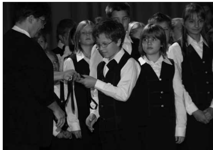
A nyakkendő átvétele