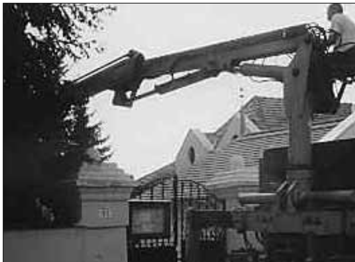
Új tetőcserepek beemelése