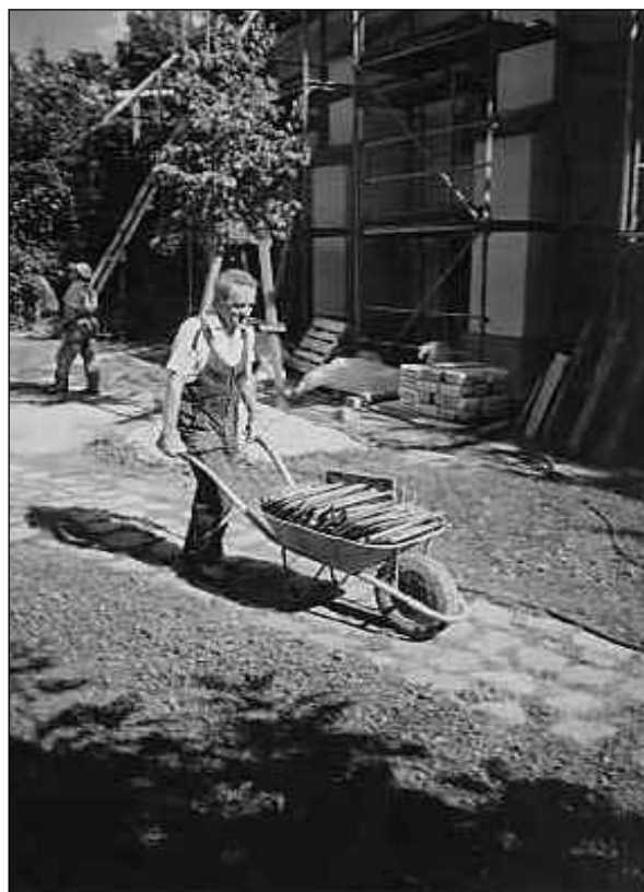
Gondnokunk cserepeket talicskáz