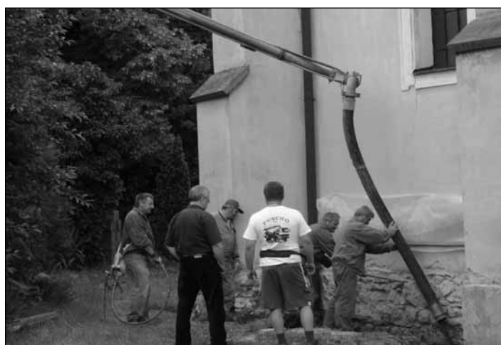
Beton-öntés az alapok megerősítéséhez