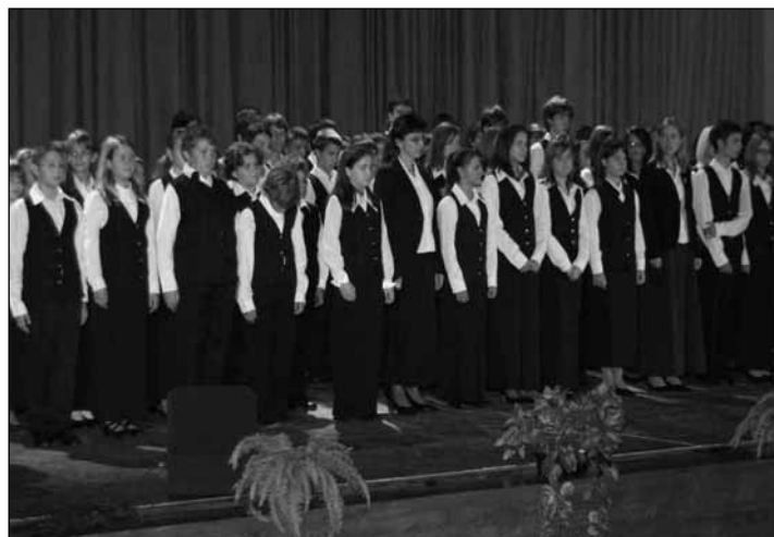
Gimnáziumunk új tanulóí