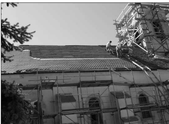
Tetőfedők a toronynál