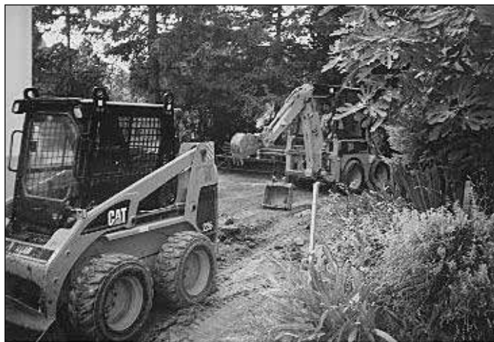
Munkagépek a templom-udvaron