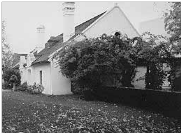
Liszt Ferenc szülőháza Doborjában