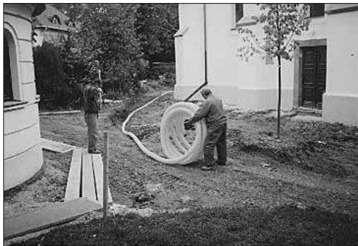
A szárítóárokba kerülő drain cső

“Mert egy gyermek születik nekünk, fiú adatik nekünk. Az uralom az ő vállán lesz...”