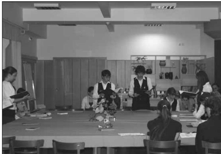
Versmondók az asztal körül