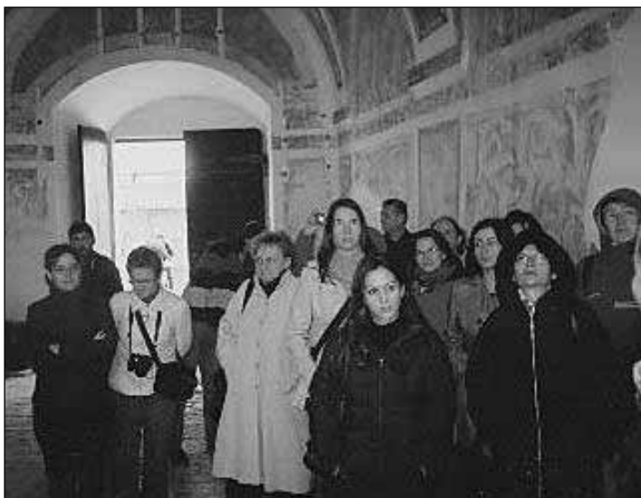
A fraknoi vár bejárata