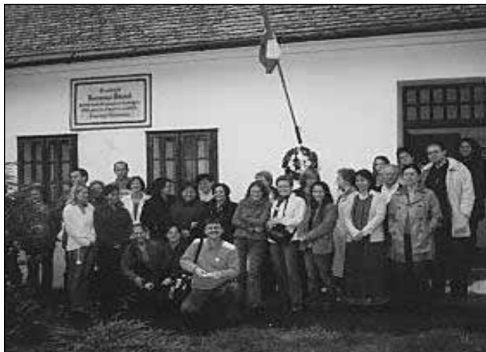
Tanáraink Berzsényi szülőháza előtt Egyházashetyén