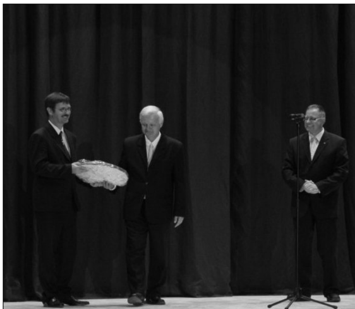
Polgármesteri ajándék átadása tornacsarnokunk színpadán