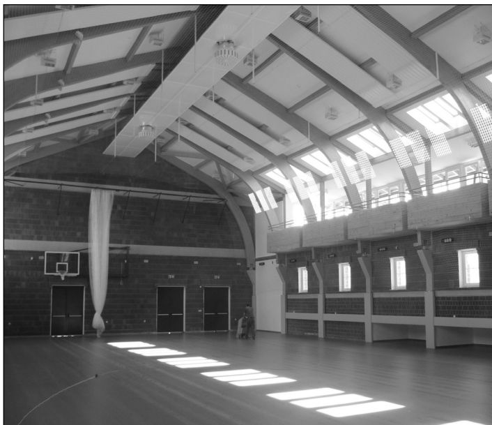
A tíz hónap alatt elkészült tornacsarnok belseje