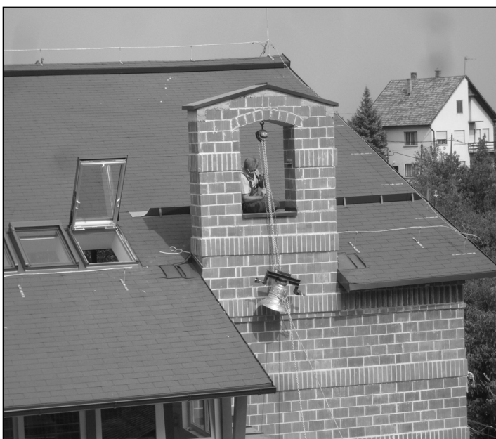
A frissen öntött harang felkerül helyére