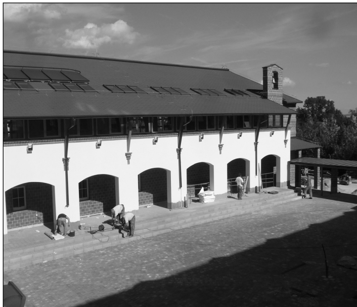
Új díszudvarunk a toronnyal