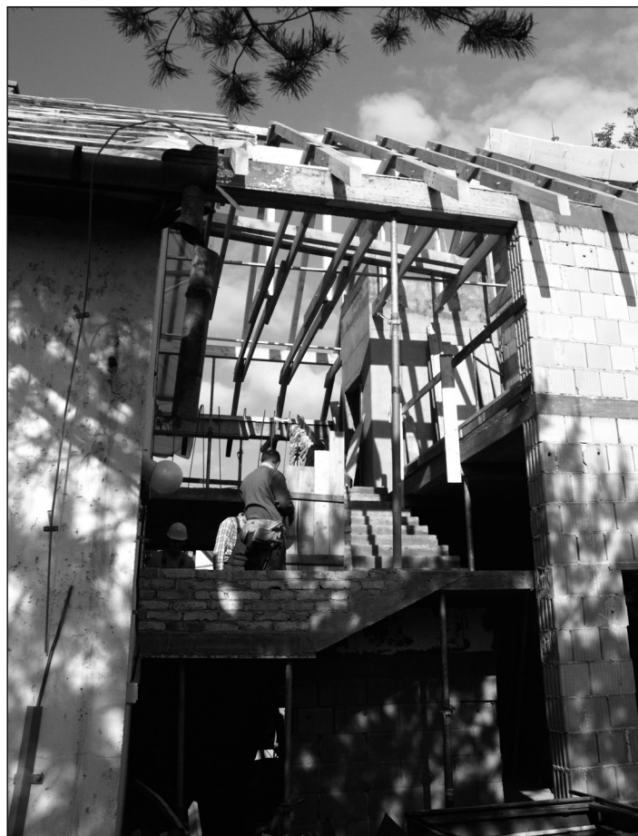
Készül az új lépcsőház óvodánkban