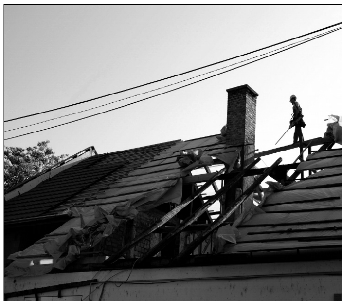
Az új tetőzet építése