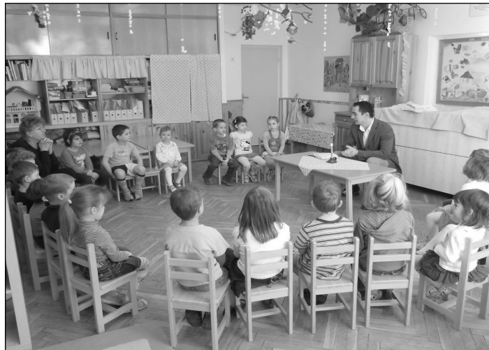
Hitéleti foglalkozás az óvodában