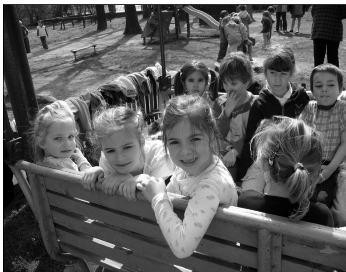
Szeretünk együtt játszani!