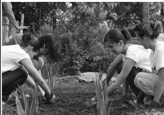
Református diákok virágot ültetnek

Péntek délután az iskolában a százötven résztvevőnek tartott nyitó áhítat után a rendezvény színes pólóban indultak csapataink a Vakok Óvodájába, a Skanzenbe, a Duna-partra és a Református Óvodába. A Skanzenben kerti munkákban segítőtünk, Szentendre belvárosában szemetet gyűjtöttünk, az óvodákban gyurmáztunk és játszottunk a kicsikkel.