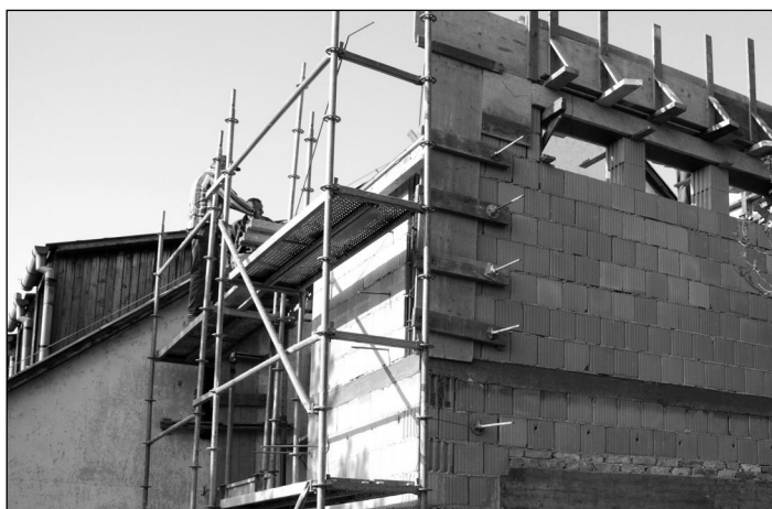
Még tető nélkül az óvoda új lépcsőháza

"Nem erővel, sem hatalommal, hanem az én Lelkemmel! - azt mondja a Seregeknek Ura." (Zak. 4,6)