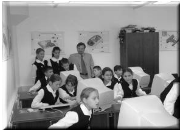
Gimnazistáink tanulják a számítógép és az internet használatát

"De a Léleknek gyümölcse: szeretet, öröm, békeesség, béketűrés, szivesség, jóság, hűség, szelídség, mértékletesség"