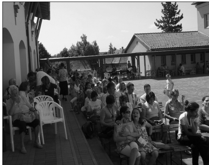
Szabadtéri istentisztelet családi napunkon