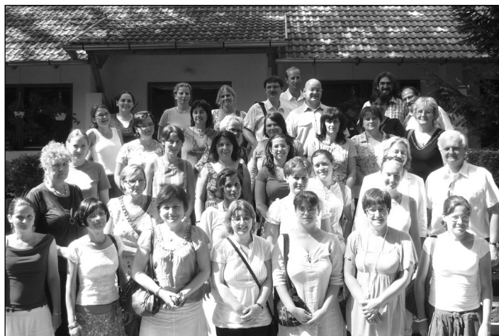
Óvónőink és tanáraink egy csoportja Tahiban

A tanévet szokásunkhoz híven tanári csendesnappal kezdtük Tahiban a Református Konferencia Központban lelkészeink vezetésével, ahol a téma "A kegyelem - tanári lelki egészségünk forrása" volt a Zsidókhöz írt levél 13,9. verse alapján.