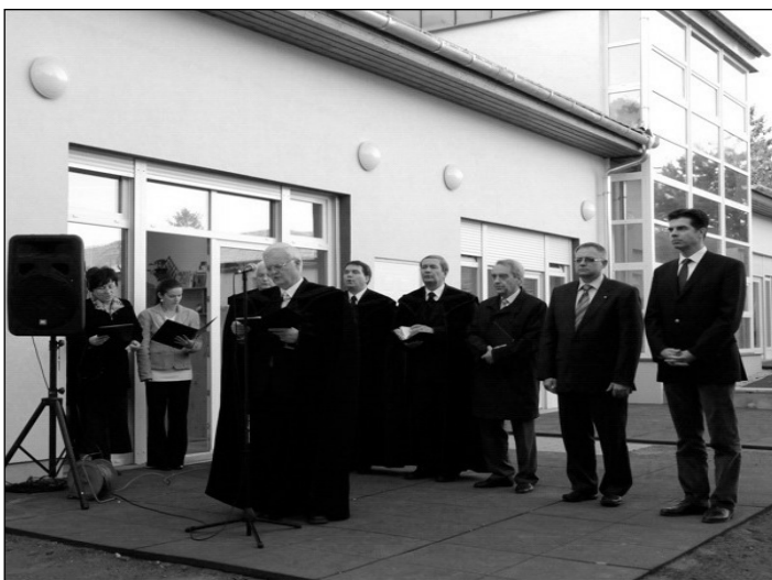
A felújított Református Óvoda ünnepélyes avatása

Mindezeket a segítségeket, áldozatokat azonban leginkább Istennek köszönjük meg, aki nem engedett minket csüggedni a nehézségekben sem, adott erőt és kitartást. Nagy boldogság egy szép felújított, minden elvárásnak megfelelő óvoda, de az én szívem akkor lesz igazán örömteli, ha majd nap, mint nap azt tapasztalom, hogy bensőséges, szeretetteljes, nyugodt napokat töltünk itt az óvodában. Akkor ezután is majd minden gyerek és szülő bizalommal lép be hozzánk. Az óvoda a gyermekek életútjának elején ad olyan alapokat, amelyek végig kísérik őket egész életükön. Reményeim szerint ez az intézmény ezután is olyan alapvető értékeket fog közvetíteni, átadni a gyerekeknek, amely megalapozza egész életüket.