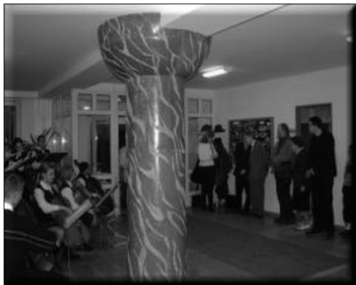
Farkas Ádám: Arbor Plantata c. vörösmárvány oszlopburkolata a Református Gimnáziumban