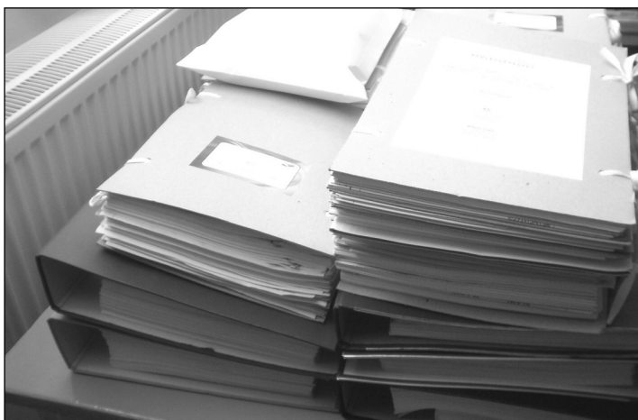
Részlet az Óvoda-felújítás adminisztrációs anyagából

“Cselekedjék veled szíved szerint, és teljesítse minden szándékodat. Hogy örvendhessünk a te szabadulásodban, és a mi Istenünk nevében zászlót lobogtassunk: teljesítse az Úr minden kérésedet!”