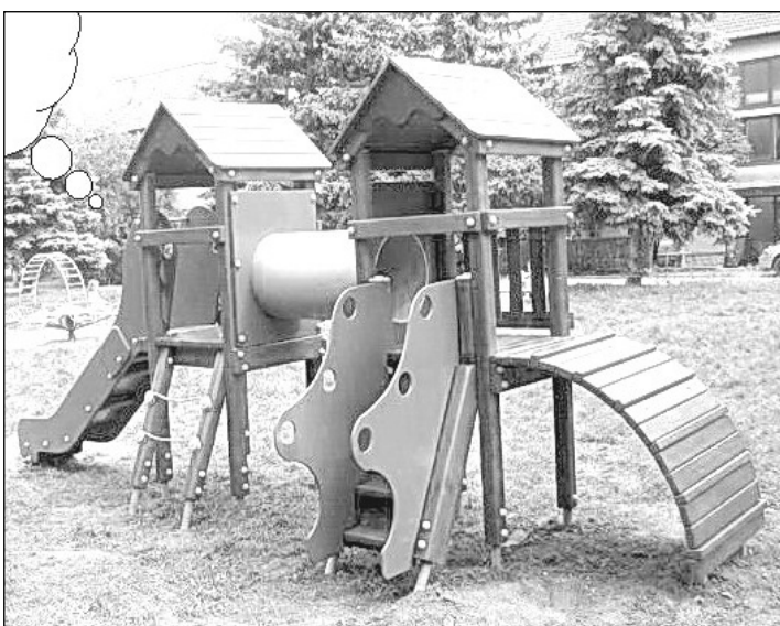
A kéttornyú mászóvár