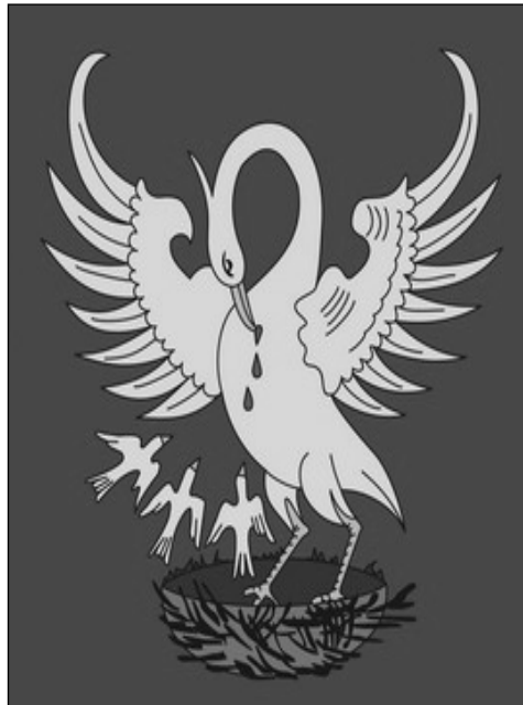
Saját testéből fiókait tápláló pelikán : az egyház ókori szimbóluma

Azonnal érezzük a kockázatot, ebben veszély rejlik, hiszen ez a fajta vezetés csak azoké, akik valóban éberek és figyelnek. Ez a fajta vezetés állandó lelki készenlétet igényel, az "alvók" (I. Kor. 11,30) nem képesek élni vele. Mostani pünkösdiünk ezért készenlétre és lelki éberségre int: szolgáljunk a Lélek újságában, és nem a