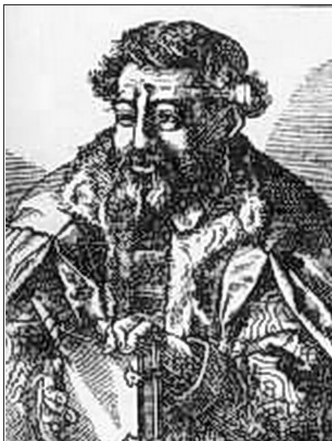
Szegedi Kis István (1505-1572) magyar reformátor