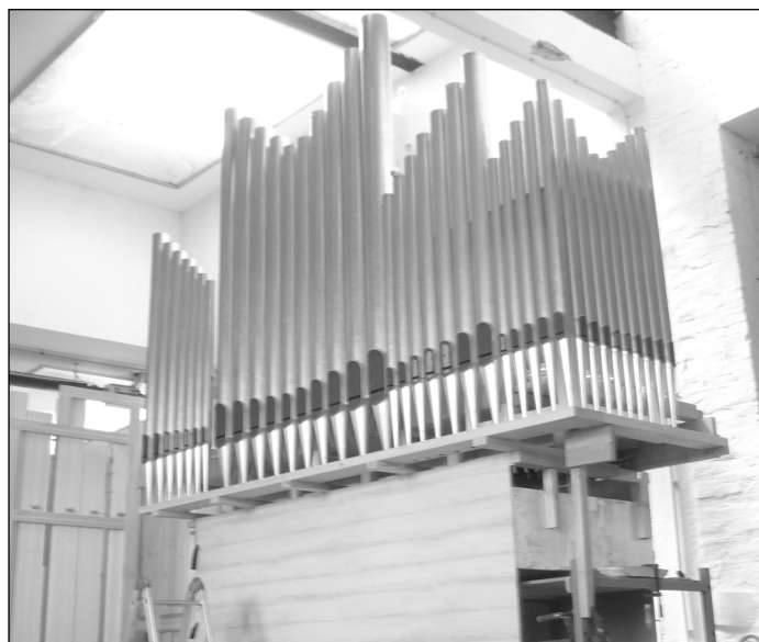
Az épülő orgona egy részlete

A manufaktúrában először megtekinthettük a fémből és fából készült sípok műhelyeit, és megcsodálhattuk a rengeteg aprólékos és pontos kézimunkát, amit egy ilyen nagyszerű hangszer alkatrészeinek létrehozása igényel. Vendégfogadóink, miközben körbe vezettek bennünket, szorgalmasan válaszoltak kíváncsi kérdéseinkre, és legtöbbször csak annyit mondtak közülünk, sosem gondolták, milyen hatalmas munka is van egy orgona elkészítésében, mennyi precizitással és hozzáértéssel kell dolgozni azoknak, akik évszázadokra megalkotnak egy ilyen hangszert, amely méltó módon dicsőíti majd Istent a nagy létszámú gimnáziumi istentiszteleteken.