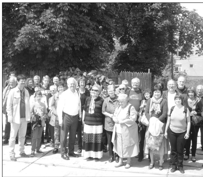
A kirándulók a műhelyek udvarán

A délutánból maradt néhány óras szabadidőt legtöbbször városi sétával, az ó-keresztény ásatások megtekintésével, a Csontváry képek vagy a Zsolnay Múzeum meglátogatásával töltötték, utána pedig beszálltunk a buszba és indultunk haza. Fáradtan és boldog szívvel érkeztünk Szentendrén a Református Gimnáziumhoz, ahonnan reggel indultunk is, mert olyan ritka élménnyel gazdagodtunk, amire sokáig emlékezni fogunk.