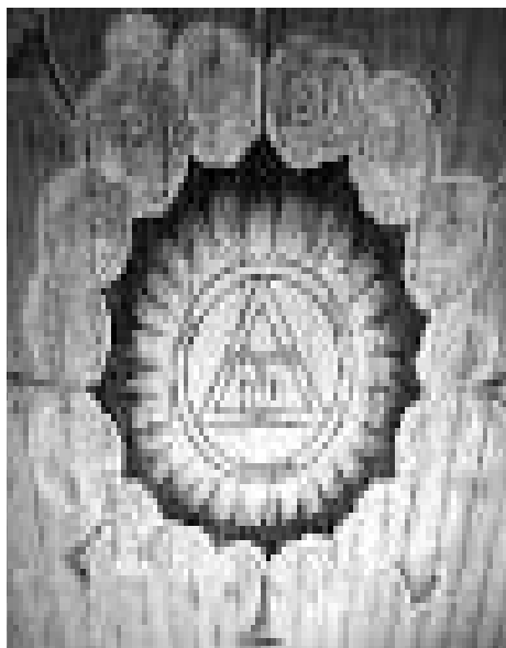
Református templomi mennyezetkazetta háromság-motívummal