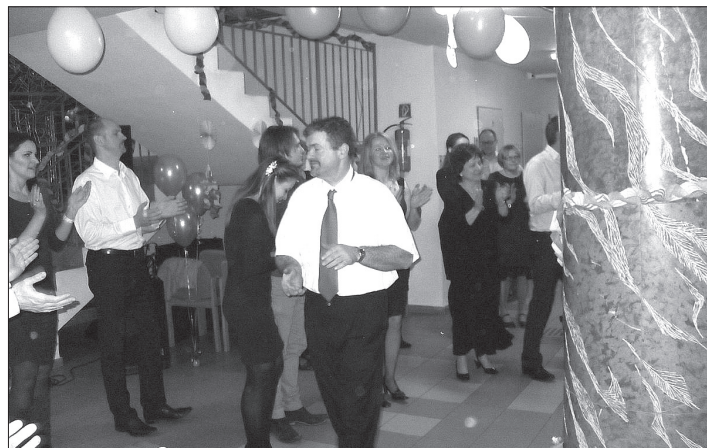
A tánc sem maradhat el

férfi hajvágás és állatorvosi utalvány pedig valóságos hangulati szökőárat vált ki. A harmadik alkalommal már könnyebb azok felé fordulni, akik első gyermeküket, szemük fényét a Szentendrén méltán elismert Református Óvodába adva bátoritanul igyekeznek szénsavmentes ásványvízhez jutni két táncverseny-forduló között.