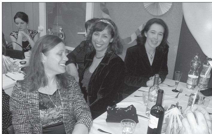
Vidám a hangulat az idei jótékonyági bálon is

Vajon miről szólhat egy óvodai bál, amelyen a szülők legszebb ruhájukat felvéve annak érdekében gyűlnek össze, hogy támogassák a Református Óvodát?