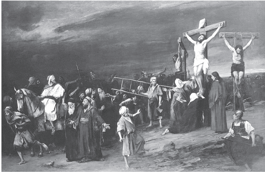
Munkácsy Mihály: Golgota

A tanú nem feltétlenül arról tanúskodik, amit lát, hanem arról, ahogyan látja, amit néz. Az emmausi tanítványok is ugyanarra a Jézusra tekintettek Jeruzsálemben, a hazafelé tartó úton és a kenyér megtörésénél is, mégis mindegyik esetben teljesen különböző módon látták Őt. Szavaik és érzéseik mindhárom esetben arról tanúskodtak,