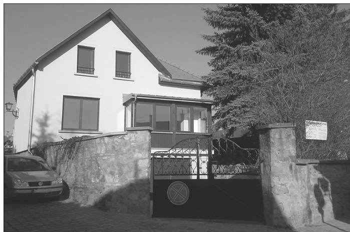
A parókia Vörösmarty utca felőli megújult homlokzata

Tavaly ősszel vette kezdetét egyházközségünk parókiájának teljes körű felújítása és bővítése. Az épület maga a templommal egy időben épült, vagyis csaknem 270 éves, és eredetileg terményraktár céljára szolgált. 1913-ban, a templom megvásárlásakor református elemi iskolává alakították, ráépítéssel megemelve az ereszt és a plafonok magasságát. A Tiszteletes utcai oldalon ma is jól látható az ereszt alatti, nagyobb kövekből készült ráépítés. Az egyházi iskolák 1950-es államosítása után az épület Rákóczi utca felé néző részéből gyülekezeti terem, a többiből lelkészlakás lett.